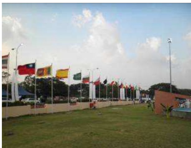
Foto: Exterior de la IILF

Las empresas pertenecientes a este sector tienen una producción anual superior a los 610 millones de euros. El 70% de la producción se destina al mercado nacional y el 30% restante a la exportación. En la actualidad, existe un ritmo de crecimiento lento pero sostenible, tras superar el periodo de reestructuración que ha redefinido a las empresas y al nuevo modelo productivo que el sector ha implantado y que se apoya en el diseño, la calidad del producto, el servicio rápido y la innovación aplicada a los productos.