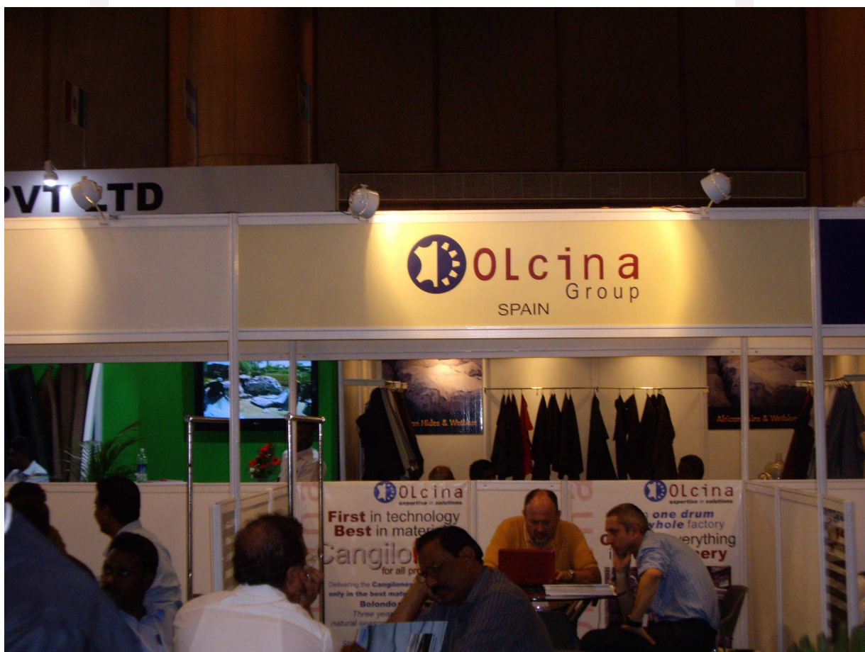
Foto: Más representación española en la IILF