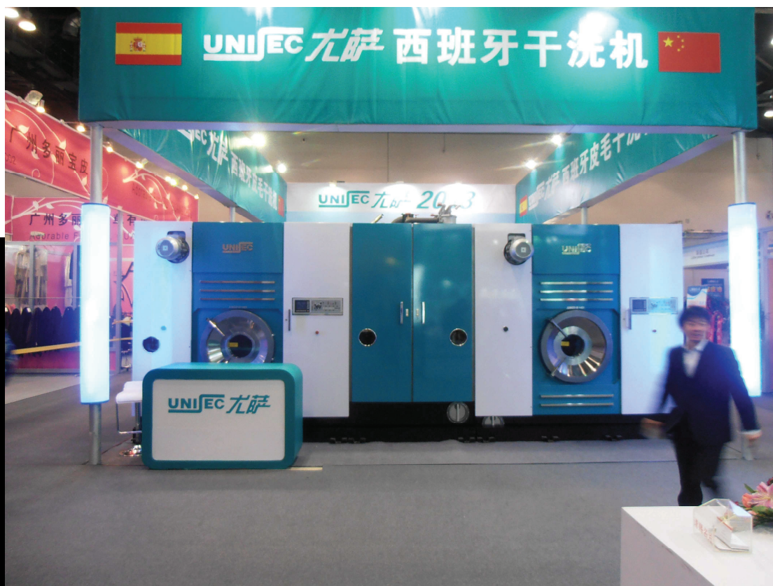
(Stand de Unijec, única representante en la Feria China 2013)